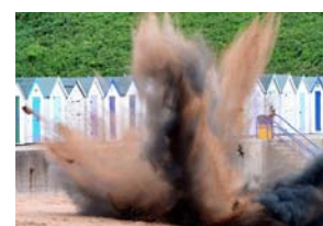
Evitate di incorrere in questo, per voi e per chi vi accompagna !