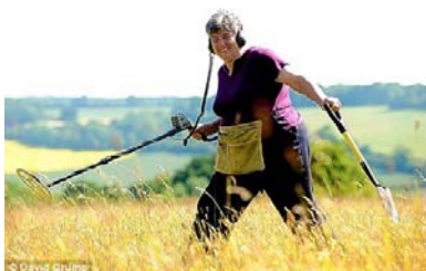
..... è un Hobby !!