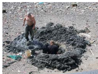
..... basta non esagerare !!