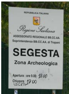
Segnaletica di Vincolo Archeologica

La vendita e l'uso del MD, in Italia, non è proibito. Ma il suo impiego deve seguire poche ma sufficientemente chiare leggi.