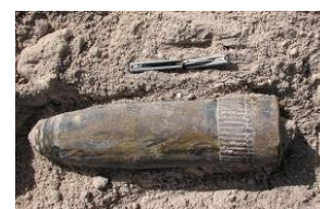
Absolutamente FERMARE le ricerche !