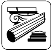
Segnaletica Area Archeologica

Innanzitutto vi ricordiamo che LA LEGGE NON AMMETTE IGNORANZA! Tanto per chiarirvi che qualora fermati dalle Autorità la frasetta "ma io non lo sapevo" NON funziona! Il nostro hobby richiede attenzione e rispetto delle norme vigenti; è stata proprio la violazione delle stesse ad assegnarci l'"ombra oscura" dei tombaroli, ed è solo il loro pieno rispetto che potrà ripulirci di questa macchia.