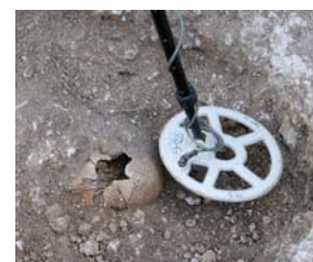
Absolutamente FERMARE le ricerche !