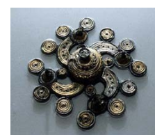
Lasciate lavorare gli esperti del settore, loro sanno come riportare l'oggetto al suo splendore.