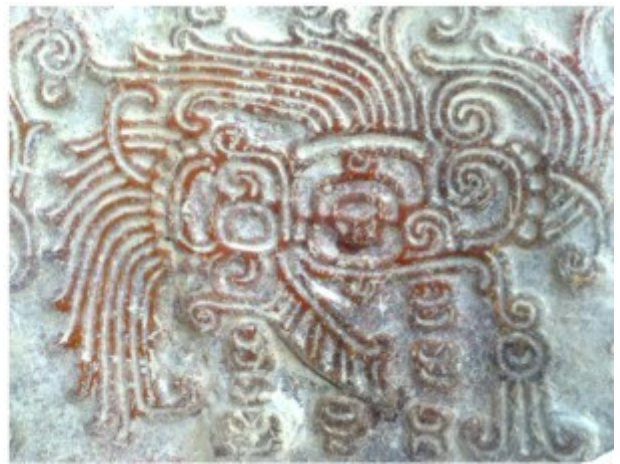
L'Occhio di Quetzalcoatl a confronto con l'Occhio di Horus