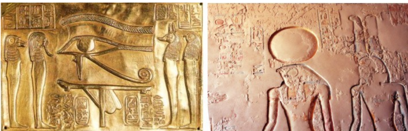
Horus e Amon in una rappresentazione nella valle dei re, notare che Amon riporta le due piume sul copricapo comunemente ritrovabili nelle rappresentazioni scultoree delle civiltà precolombiane; a fianco una rappresentazione egizia dell'occhio di Horus.