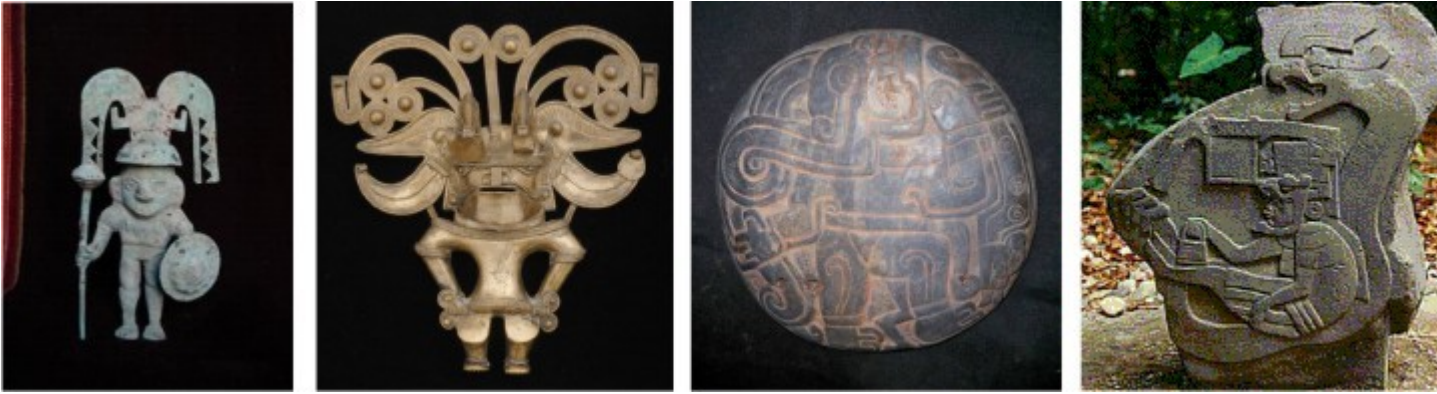
Rappresentazioni Moche, Tumbaga, Chavin, Olmeca; notare l'arpione ed i copricapi che evidenziano la prerogativa del librarsi in volo.