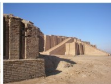
Confronto tra le piramidi di Teotihuacan in Messico, quelle di Giza in Egitto e la ziggurat di Ur.