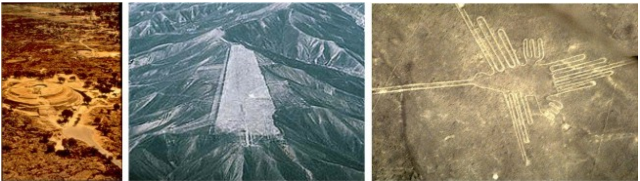
L'imponente piramide di Cuicuilco, nella valle di Anahuac, a pochi Km da Città del Messico, a fianco una sorta di pista di atterraggio che si trova a 3000 km a sud del Peru e una raffigurazione delle Linee di Nazca scoperte casualmente nel primo novecento dal geografo americano Paul Kosok e studiate ampiamente dall'archeologa Maria Reich dell'Università di Amburgo.