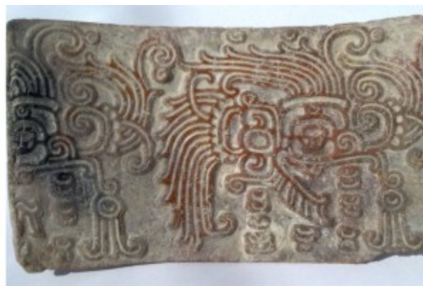
L'azteco Occhio di Quetzalcoatl, la rappresentazione del corrispondente egizio Occhio di Horus; o meglio come dice Sitchin nella traduzione della sua undicesima tavoletta sumera, "la Colonna Fiammeggiante, il Pesce Celeste donato a Horon da Ningishzidda".

La figura di Quetzalcoatl si esprime attraverso il culto del serpente alato, molto diffuso nell'America Centrale del periodo precolombiano dove appare legato ad un popolo di astronomi che abitava il Messico addirittura 3500 anni fa ed è legato ai mitici "Sapienti dalla pelle chiara", che apparivano come serpenti ricoperti di piume e che sarebbero giunti in Messico su grandi navi senza remi. Questi misteriosi individui dai tratti caucasici, "forse i superstiti della popolazione atlantidea", sono stati rappresentati a La Venta addirittura in enormi sculture. Presso i popoli dell'America Centrale il Serpente piumato è visto come portatore di civiltà, maestro di astronomia e architettura. Ecco perché secondo le leggende maya il dio serpente portò in Messico l'arte delle piramidi e queste stesse leggende descrivono le piramidi anche come strumenti per trasformare l'anima dopo la morte, con vaghe correlazioni con l'Egitto e proprio in Egitto, infatti, è stata trovata la rappresentazione di un'anima umana che riposa su un serpente piumato e negli antichi miti locali il drago Apep governava proprio il mondo delle tenebre.