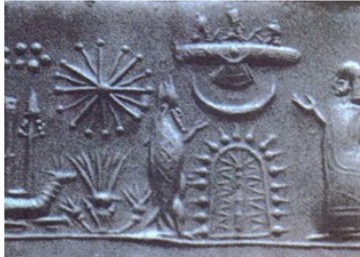
Sopra una persona attaccata da esseri uccello (2000-1600 a.C.) e un sigillo raffigurante Annunaki.