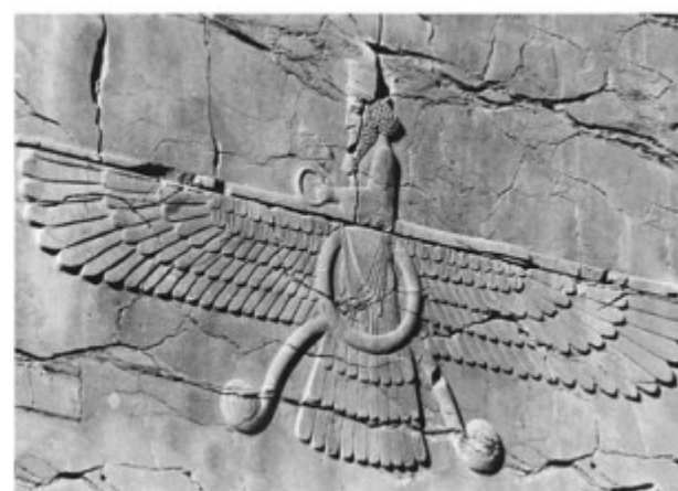
Le stesse divinità nelle tre diverse culture: sumera, egizia e olmeca rappresentanti gli "dei uccello"

Assume un enorme importanza il fatto che questo artefatto dimostra e chiarisce dalle false interpretazioni l'originario e reale significato dell'Occhio di Horus, proprio perché qui l'artista ha rappresentato quello che realmente vedeva; una macchina volante che poteva librarsi in cielo e atterrare a piacere, ciò che le rappresentazioni degli egizi, per capacità artistica e cultura, non hanno saputo dare; anche se nel loro Libro dei morti molto chiari sono i versi che attribuiscono all'Occhio il potere di volare, ad esempio: "In verità io sono il figlio primogenito di Osiride Ed io dimoro nell'Occhio divino" ... "Allora simile ad un grande Falco d'Oro dalla testa di Fenice lo spicco il volo verso il cielo" ... "Io sono Horus, io che mi approprio della Barca celeste" ... "Guarda! È l'Occhio di Horus Che si eleva fiammeggiante, innanzi a te" ... " Simile al Falco di Horus io mi libro nel cielo; le mie grida sono acute, come quelle di un'anatra selvatica, (altre volte sono paragonate ad un uccello acquatico) Io discendo, volteggiando verso la Regione