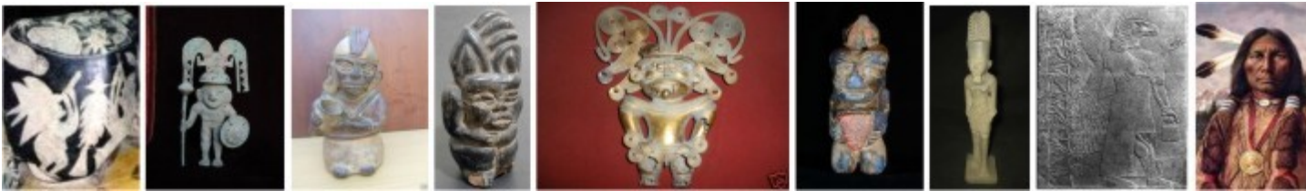
Il ricordo degli dèi piumati nelle culture Ica, moche, tumbaga, egizia, sumera e indiani d'oggi.

Tornando in America, ecco spiegato il perché solo dall'alto, sono apprezzabili le misteriose figure Nazca, che non sono altro che la rappresentazione di animali ed esseri rappresentati anche dalla stessa oreficeria tumbaga e dall'arte precolombiana in genere. Ecco perché nelle rappresentazioni antropomorfe appare sempre un copricapo piumato che arriva perfino a rappresentare il movimento con quei riccioli a spirale che l'artista precolombiano usava in genere per dare il senso del movimento. Gli esseri rappresentati sono sempre gli stessi dei civilizzatori venuti dal cielo e considerati dalle genti primitive degli Dèi. Si noterà che dalle Pietre di Ica sino ai giorni nostri, le varie etnie americane attraverso le rappresentazioni dei copricapo piumati hanno sempre rappresentato e portato con sé il ricordo di questo incontro con gli esseri celesti che avevano la capacità di volare con i loro mezzi incomprensibili, e da questo atavico ricordo hanno portato con sé fino ai giorni nostri il mito azteco del Serpente piumato e dei guerrieri aquila.