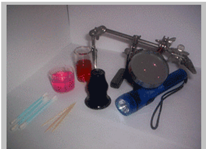
E' molto importante scegliere gli strumenti adatti

Lente di ingrandimento: E' un oggetto quasi indispensabile per questi casi. In effetti, la pulizia può dar luogo ad alcuni effetti