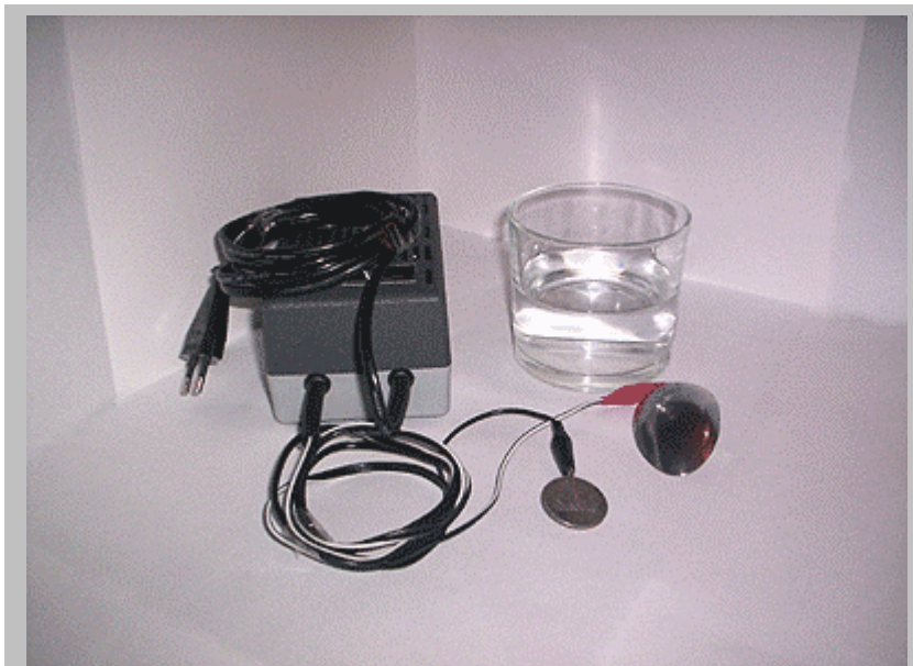
Un semplice apparecchio per elettrolisi autocostruito, Esso è composto da un piccolo alimentatore, a cui sono stati collegati dei morsetti a coccodrillo all'estremità del cavo da 6V. Un vecchio cucchiaino è stato collegato al polo positivo, mentre la moneta è collegata al negativo.

Preparare la soluzione per la pulizia, buttando due cucchiaini di sale da cucina ed un cucchiaino di succo di limone concentrato in una tazza di acqua tiepida. Invece del sale, si può anche usare della soda caustica, nel caso si voglia aumentare l'effetto di elettrolisi.